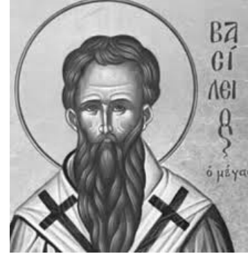
svätý Bazil Veľký

Pre dobu, v ktorej Bazil a Gregor žili (4. st.), bolo charakteristické hlásanie bludov v kresťanstve, predovšetkým arianizmu (popieranie božstva Ježiša Krista, tvrdenie, že Ježiš bol len človekom). Bazil i Gregor proti arianizmu bojovali. Nemali to ľahké – nedostalo sa im podpory ani od vtedajších cirkevných autorít. Tie predovšetkým Bazilov boj brali ako ctižiadostivú snahu vyniknúť, nie ako nasadenie obrániť a očistiť vieru. Uznania od Cirkvi sa Bazilovi dostalo až po smrti.