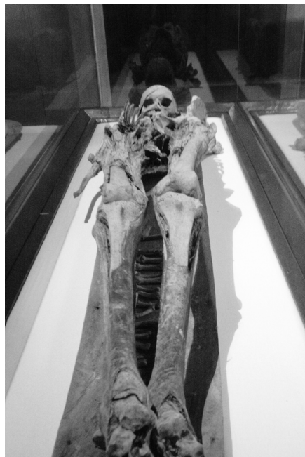
„Pamätaj, že si prach a na prach sa obrátiš“ - pre pustovníkov častý námet k meditácii

Kappadóciu nazývame kolískou cirkevných otcov. Najznámejšími svätými tohto regiónu sú sv. Bazil Veľký a sv. Gregor Naziánsky. Obaja boli