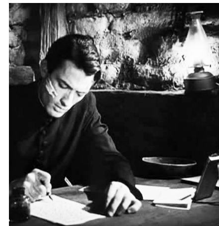
postavu mladého kňaza Chisholma, misionára v Číne, stvárnil vo filme z roku 1944 Gregory Peck

Slušnosť vyžadovala, aby sa Sleeth chlapco-