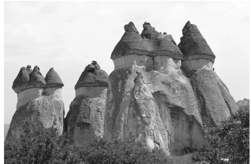
V Kappadócii sa príroda zahrála na výtvarníka

Je to jeden z najznámejších a najkrajších regiónov Turecka. Voda, vietor a slnko tu utvorili zo skál nádherné útvary. Do Kappadócie prichádzali prví kresťania v snahe uniknúť prenasledovaniu a v pozoruhodnej harmónii si tu vyhľadali do pieskovcových skál príbytky a chrámy. Po vyhlásení kresťanstva za povolené náboženstvo sem prichádzalo ešte väčšie množstvo ľudí túžiacich žiť kontemplatívnym životom.