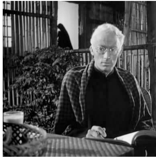
Chisholm na sklonku života

Vyzrel z okna a zbadal Andreja, ako zo stromov oberá hrušky a slivky. Pochopil, že je to dar preňho. Nechcel takýto dar, zmocnila sa ho nevysvetliteľná túžba ujsť. Keď po zaklopaní chlapec vošiel do izby, jedna slivka z košíka mu vypadla a zakotúľala sa pod posteľ. Chlapec sa zohol a neobratne ju zdvihol – jemná kožtička na ovocí pukla a šťava z nej sa mu rozlievala po prstoch. „Tá nebude stáť zaveľa... čo?“ chladne povedal Sleeth. Chlapec mlčal. „Tak pýtal som sa, bude či nebude?“ „Nie, dôstojný pane!“ „Ty si tvrdohlavý chalan. Nevychovaný. Celý týždeň ťa pozorujem. Prečo sa mi nepozeraš do očí?“ So strašným úsilím chlapec odlepil oči od dlážky.