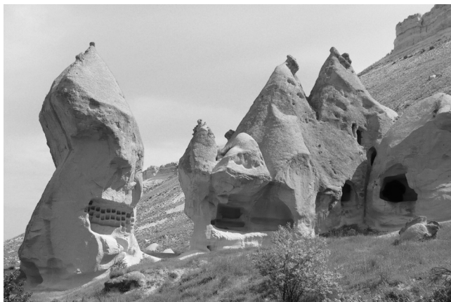
pustovníci si svoje prilytky vyhlbovali do skál

V celej Kappadóci sa nachádza asi 1000 kostolov a v okolí najznámejšieho mestečka Göreme, kde sú tieto pamiatky najviac koncentrované, sa ich nachádza asi tristo. Žiaľ, v Turecku sa kresťanským pamiatkam nedostáva dostatok pozornosti. Hoci sú obrovským kresťanským dedičstvom ľudstva, tu slúžia takmer výlučne ako obchodný artikel.